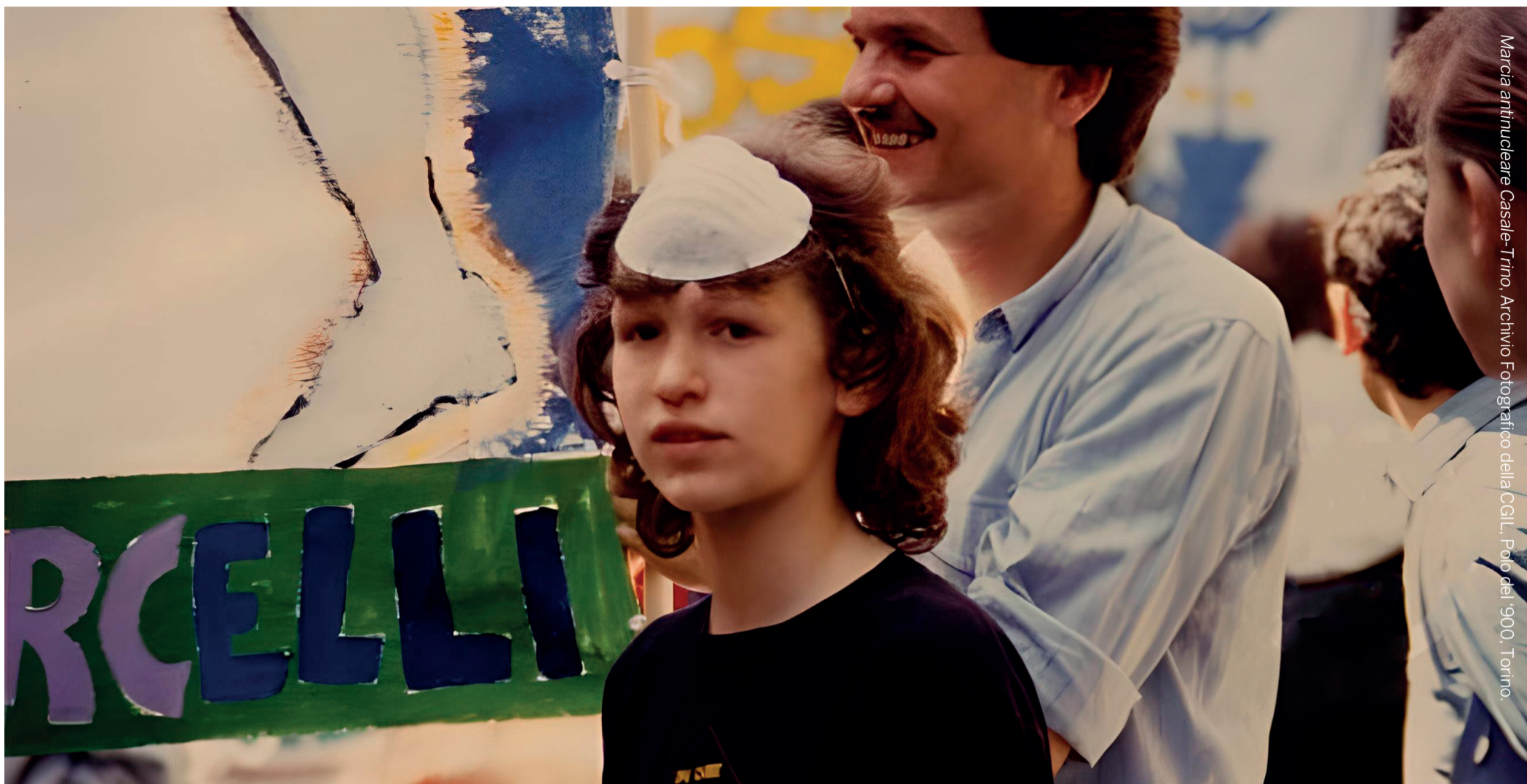
Marcia antinucleare Casale-Trino.